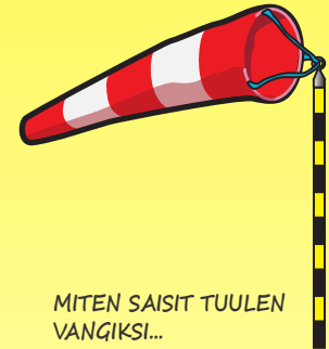
MITEN SAISIT TUULEN VANGIKSI...