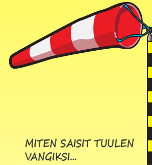
MITEN SAISIT TUULEN VANGIKSI...