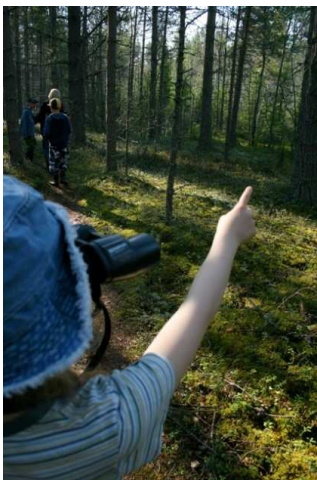
Lasten lintuleirillä toukokuussa 2010.