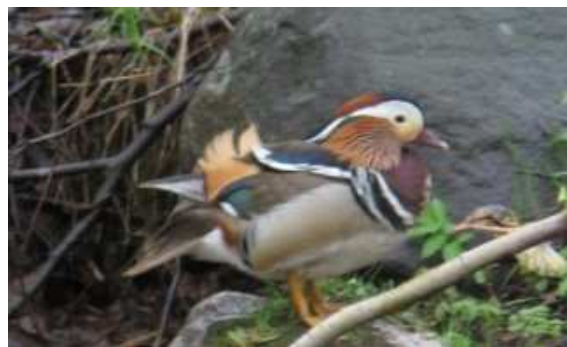
Mandariinisorsa, kuvattu Oulun keskustassa Laanaojassa.

"Suosittelen lintuharrastusta muille lapsille, koska se on monipuolista."